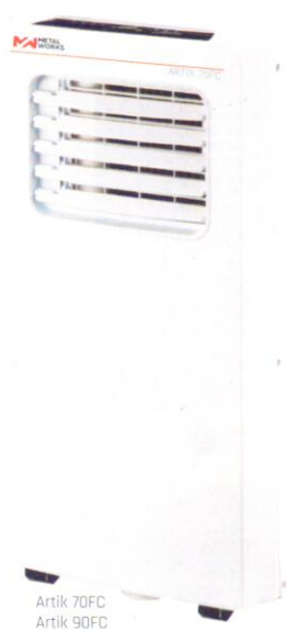
Artik 70FC Artik 90FC